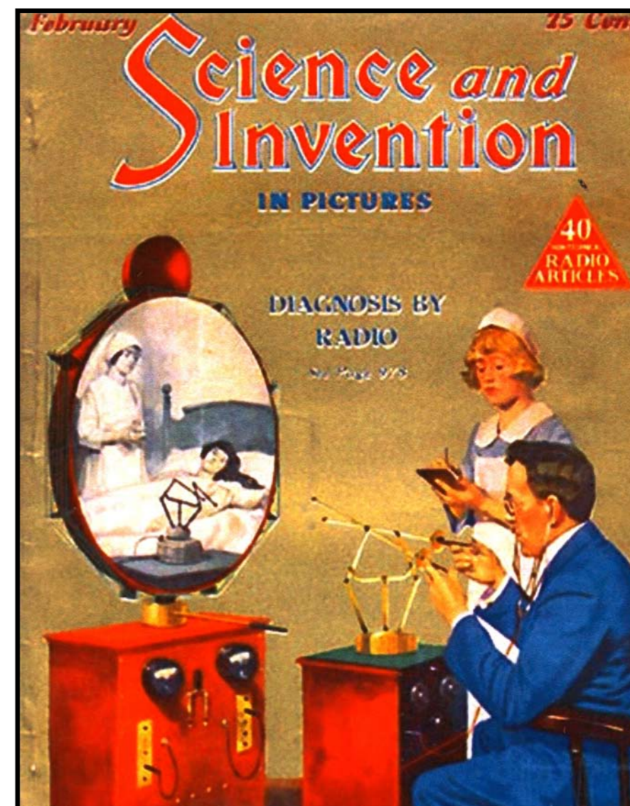
O "avô" das cirurgias e diagnósticos remotos por vídeo, na ilustração na capa da revista Science and Invention de 1925

zados...) na maioria dos países em desenvolvimento. Diferentemente dos setores econômicos tradicionais a economia criativa (que cresce mais que a média da economia, de acordo com a UNCTAD) vai além do impacto meramente econômico. Ela é tão estratégica para um desenvolvimento sustentável por ter impactos positivos nas outras dimensões: social, ambiental e cultural. O interessante é que podemos notar esse impacto positivo multidimensional em atividades de uma gama ampla, que vão de uma São Paulo Fashion Week a um Doutores da Alegria. O patrimônio intangível (por exemplo, a imensa diversidade cultural dos nossos mais de cinco mil municípios) pode ser convertido em qualidade de vida se soubermos mudar formas de pensar e agir para entrar de fato no século XXI.