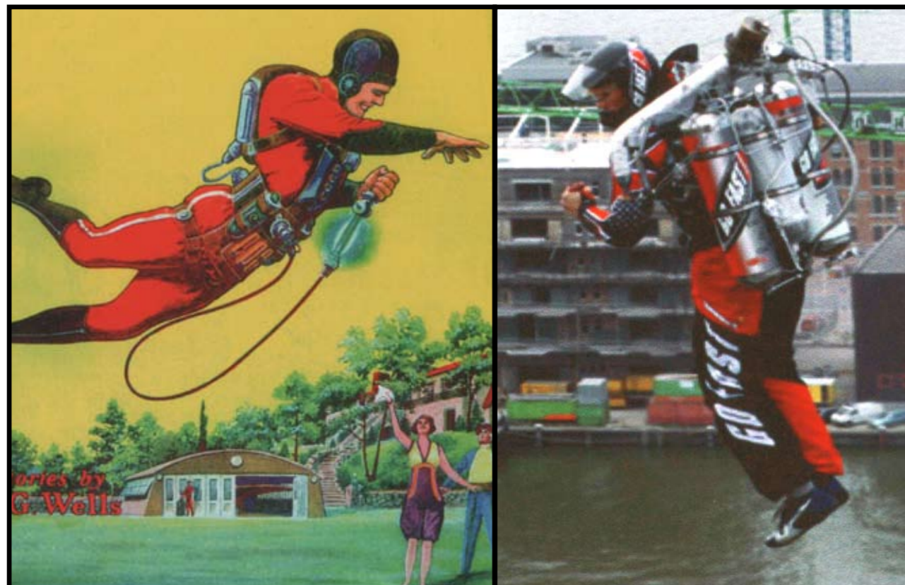
O futuro é fruto dos sonhos do passado e escolhas do presente: até a roupa vermelha imaginada em 1928 por Frank R. Paul em Capa Amazing Stories (1928) viria a se concretizar na demonstração do Jet Pack H202, em 2007