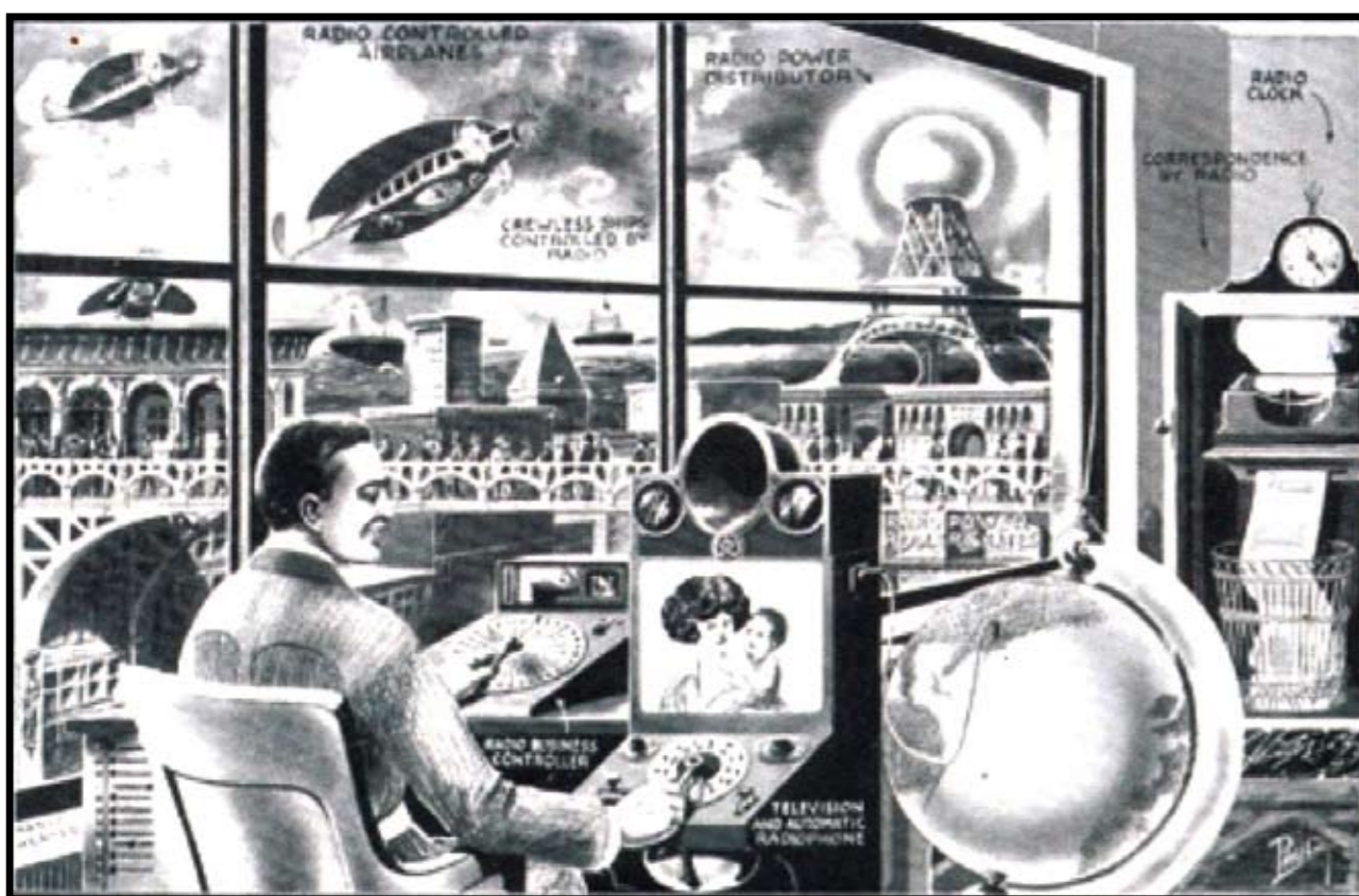
Skipe, antena, fax, aviões controlados por rádio foram antecipadas pela ilustração de Frank R. Paul, em "The Future of Radio", em 1922

O desenho do mundo depende dos nossos sonhos. Por isso o primeiro passo para construir a realidade que queremos está na transformação do modo de pensar. Eis aí o nosso grande desafio: cultivar sonhos do tamanho do que desejamos para o mundo dos nossos filhos, dos filhos dos nossos filhos e, quem sabe, do nosso próprio